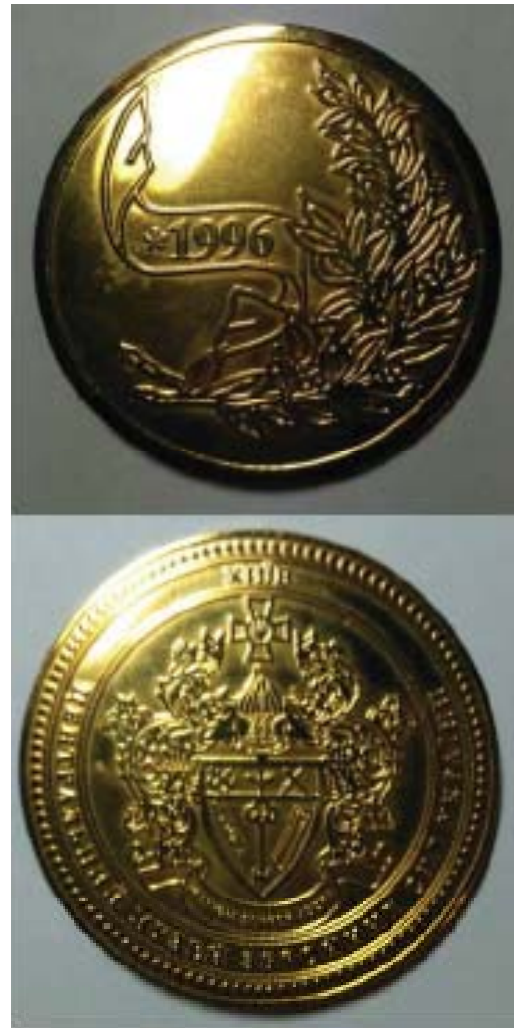
Фото 4. Пропам'ятна медаль Національного військово-історичного музею України.

Крім того, за його наполегливої участі було впроваджено систему професійної підготовки